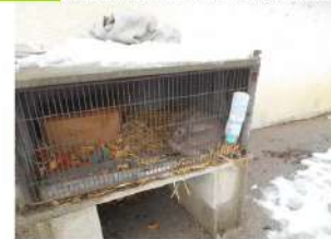
Etouille, notre lapin mange les épluchures des fruits.