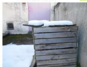
Nous jetons les peaux de banane au composteur.